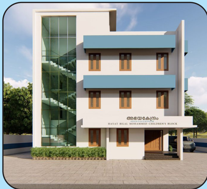
CHILDREN'S BLOCK UNDER CONSTRUCTION